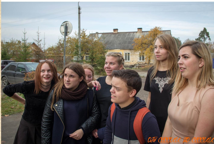
ОТН СЕРВЕСА ДО СЕРВЕСА