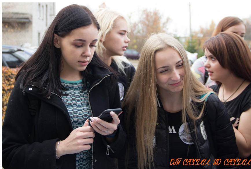
ОТН СЕРВЕСА ДО СЕРВЕСА