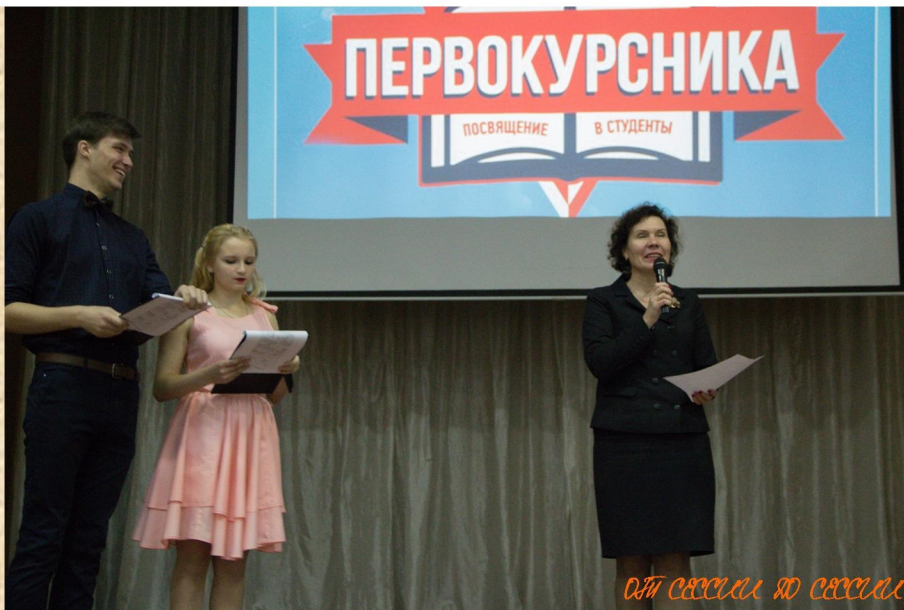
ОТН СЕРВЕСА ДО СЕРВЕСА

ИС, внештатный корреспондент, фотографии Толи Ушкова, Игоря Шмелева, Макса Миклоша