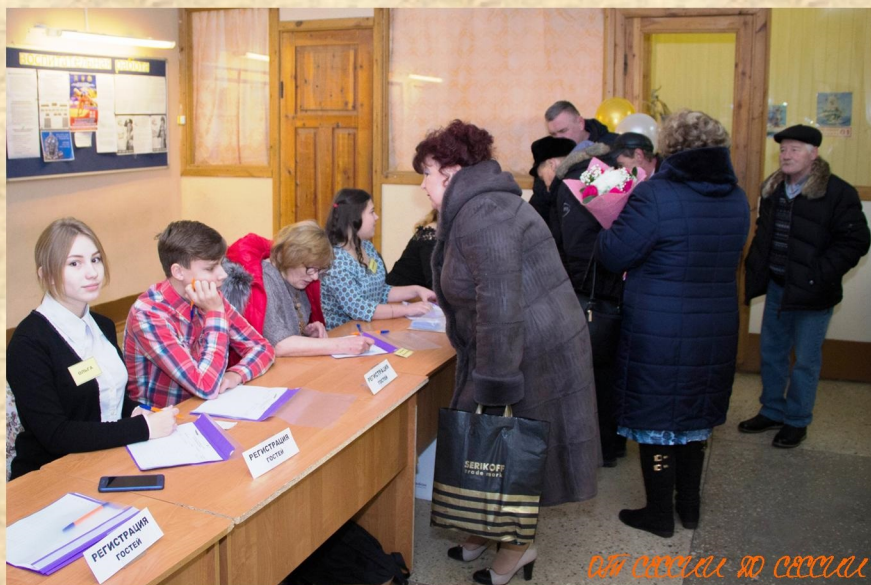
Они связаны до смерти

И вот долгожданный день наступил! 14 декабря 2018 года в Псковский агротехнический колледж пришел большой юбилей—115 лет с мо-