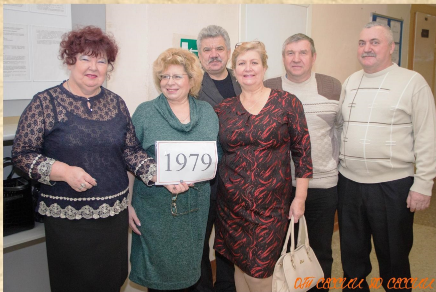
Они связаны до смерти

Казалось бы, день начался как обычно. Учебные занятия, перемены, вопросы преподава-