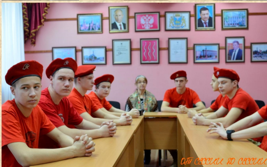
ОТ СОСЕДИ ДО СОСЕДИ